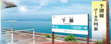
予讃線 ローカル列車

このパンフレットが届いたお客様限定価格 参加費用 8,980円 (税込) 同伴者様も同料金でご参加いただけます!