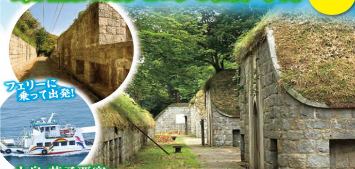
フェリーに乗って出発!